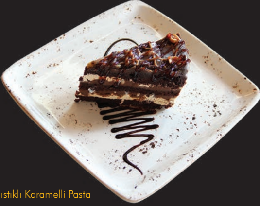
Yer Fıstıklı Karamelli Pasta