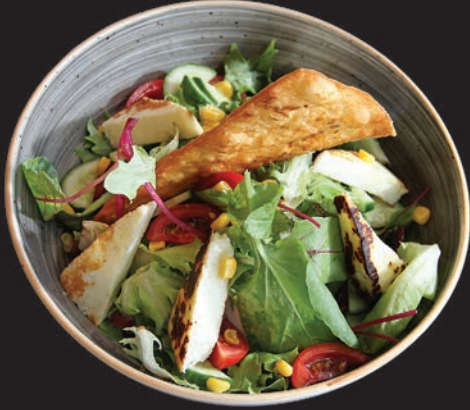
Izgara Hellim Salata