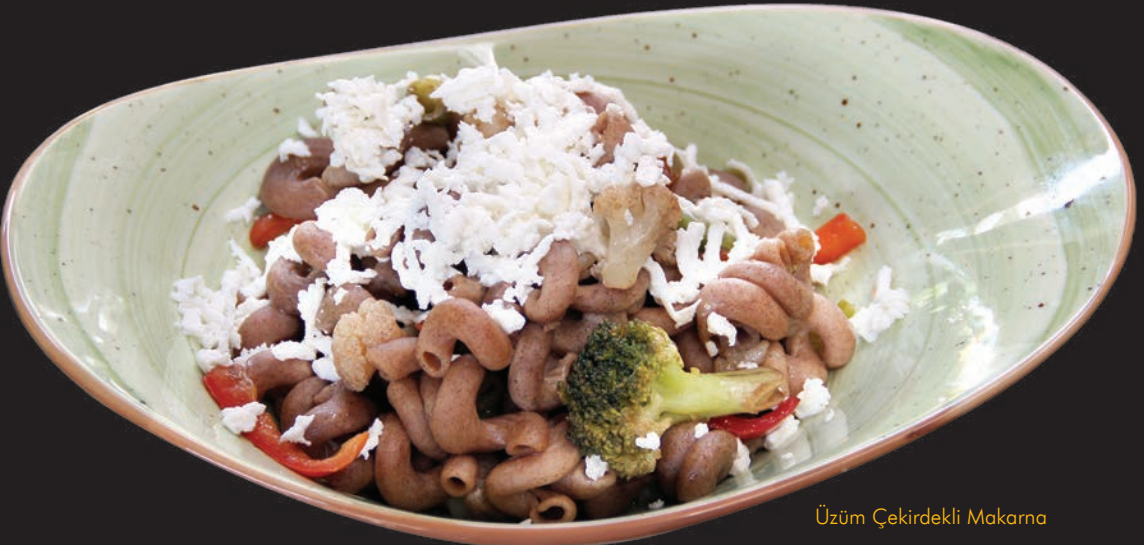
Üzüm Çekirdekli Makarna