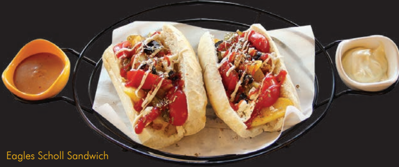
Eagles Scholl Sandwich