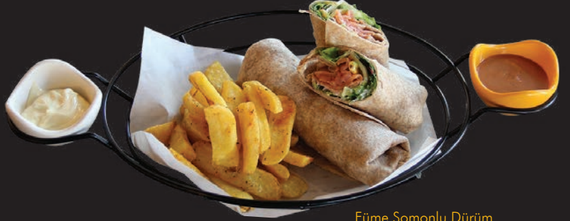
Füme Somonlu Dürüm