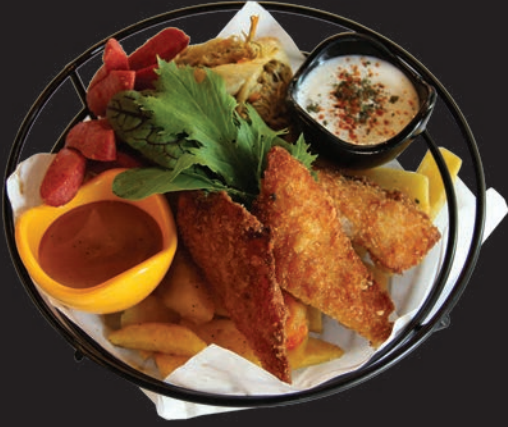
Eagles Özel Ara Sıcak Tabađı