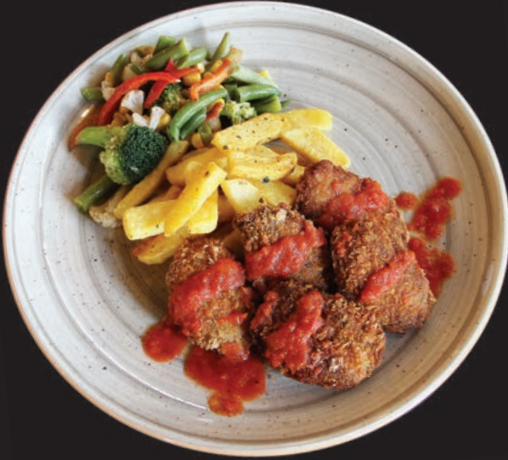
Eagles Çıtır Köfte