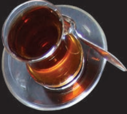
Eagles Kahvaltı Tabağı