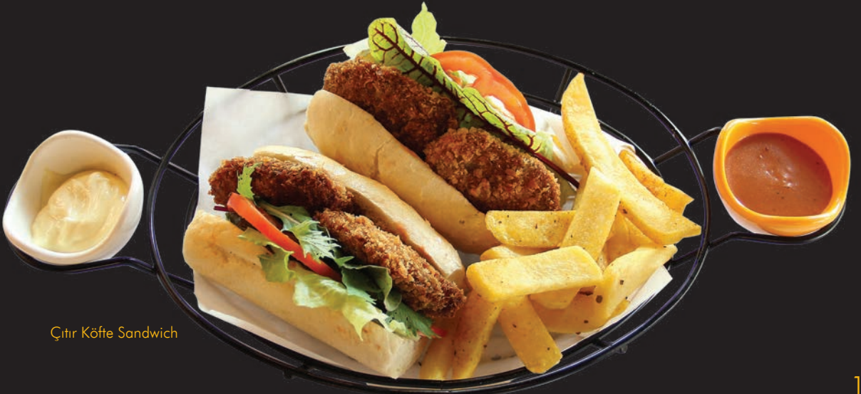
Çıtır Köfte Sandwich