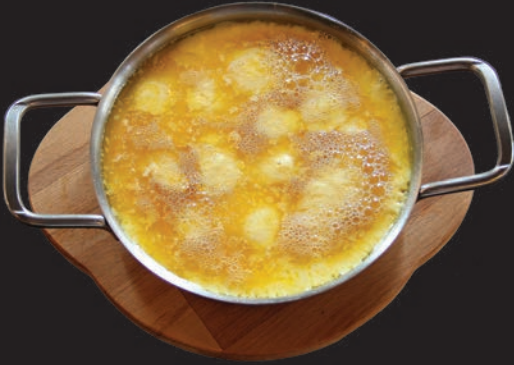
Dođu Karadeniz Usulu Muhlama