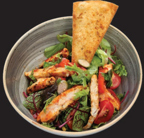
Sweet Chili Salata