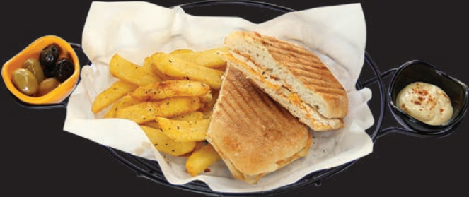
Tavuklu Cheddar Tost