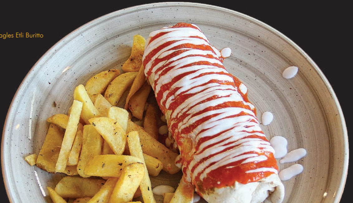
Eogles Etli Buritto