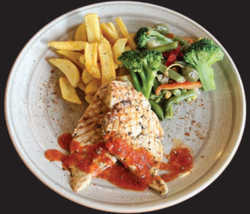
Izgara Tavuk Göğsü