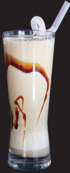
Ice Caramel Mocha