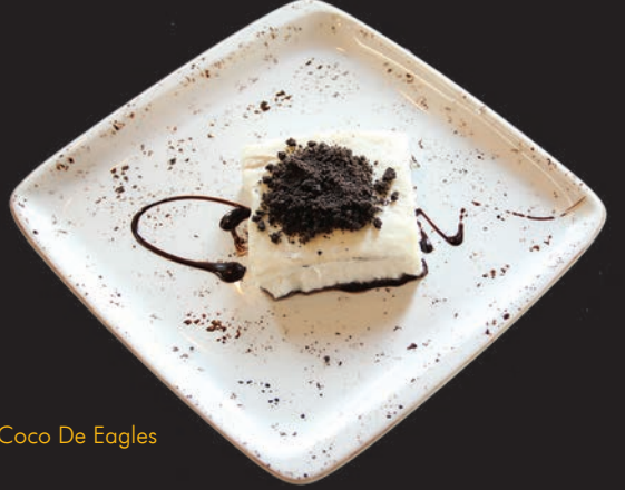
Coco De Eagles