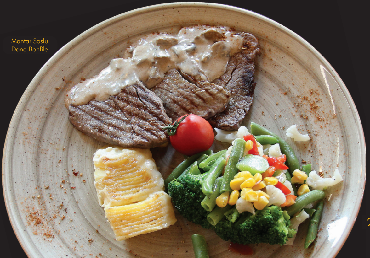
Mantar Soslu Dana Bonfile