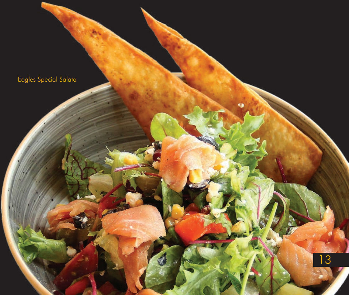
Eagles Special Salata