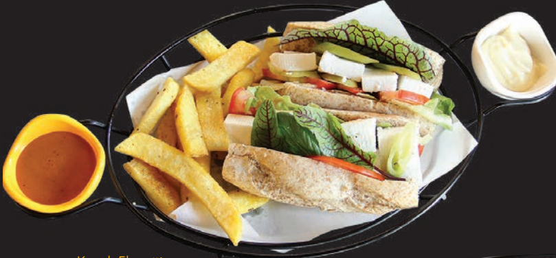
Kepek Ekmeğine Beyaz Peyirli Sandwich