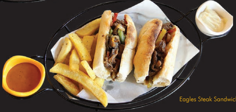
Eagles Steak Sandwich