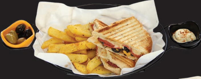
Eagles Süper Tost