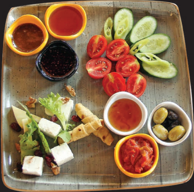
Anadolu Kahvaltı Tabağı