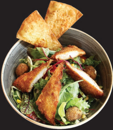
Çıtır Tavuk Salata