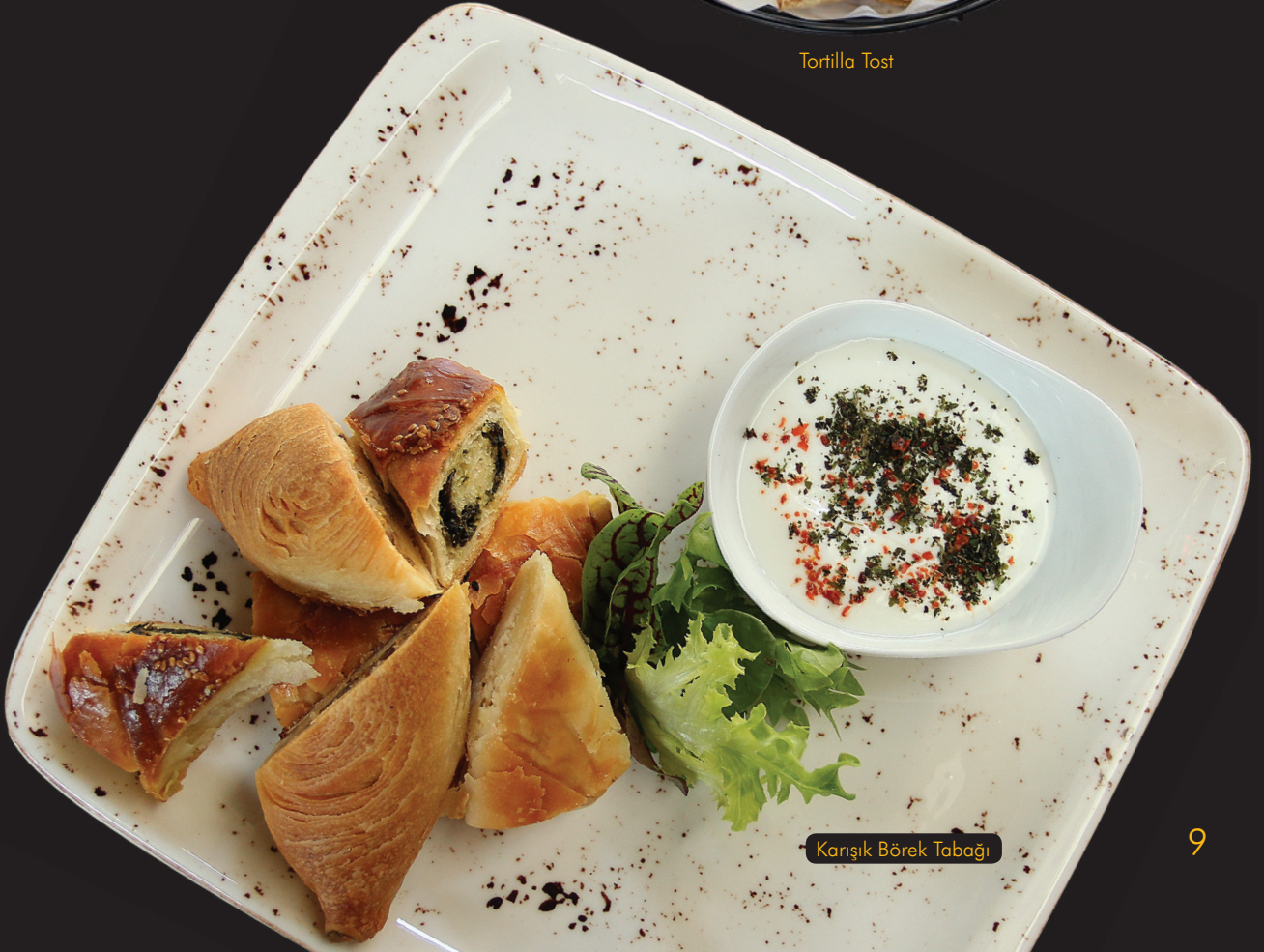
Karışık Börek Tabağı