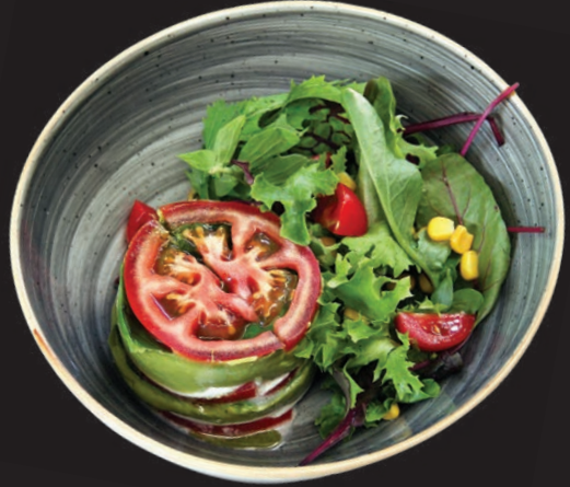
Avakado Mozerella Kulesi